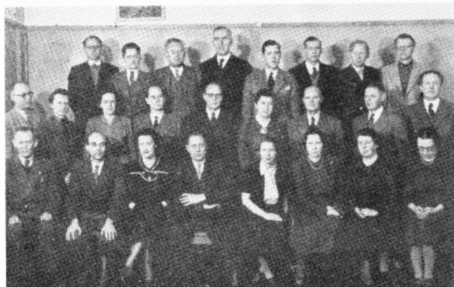
Således så katedralskolens lærerkollegium ud i 1948.

Fr. Ingerslev var et kapitel for sig. Ham havde vi i tysk, og han er årsag til, at jeg den dag i dag i søvne kan sige »Durch, für, gegen, ohne, wieder, um - kennst du nicht Akkusativ, bist du wirklich dumm«. (Bogstaveringen garanterer jeg dog ikke for). Han havde en airedaletterier, som jeg af en eller anden grund fik til opgave at hente. Samtidig skulle jeg have hans barbergrej med, for han ville ikke risikere at besmitte sin hud med barberens egne sager. Den hund glemmer jeg aldrig. Den var glubsk og modbydelig, men han pålagde mig, at jeg blot skulle sige »Op til far, op til far«, så mens jeg skrækslagen vandrede med den fra Roarsvej, ad Violstræde og Weysegangen op