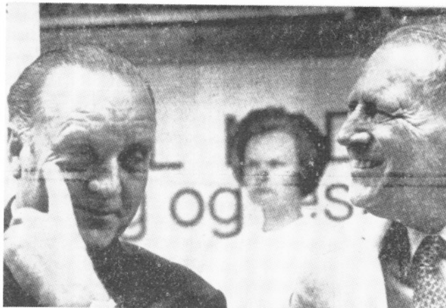
Kong Frederik griner, mens præsidenten polisk gnider sig ved det ene øje. Om damen i baggrunden intet vil eller kan høre, foreligger der intet.